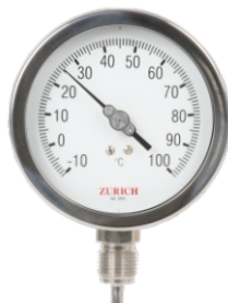
TZI Termômetro Bimetálico