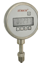
TZD.RG Registrador (4 pilhas AA)