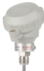
T.420.I Transmissor de Termômetro