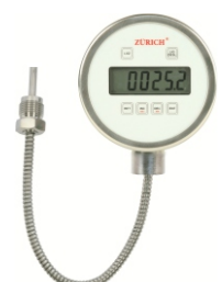
TZD.FLEX Processos de Difícil Acesso